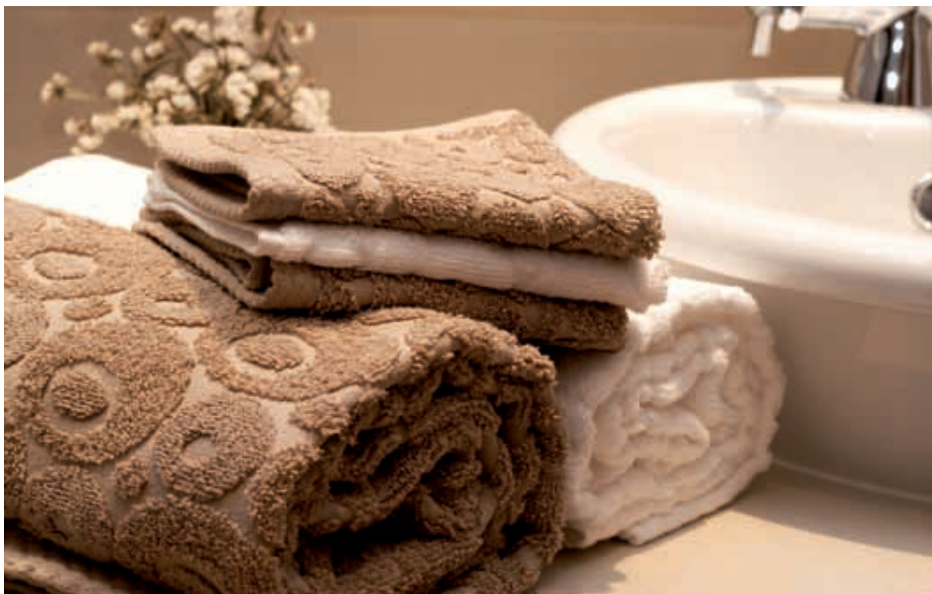
Brisače lahko izpopolnijo izgled kopalnice