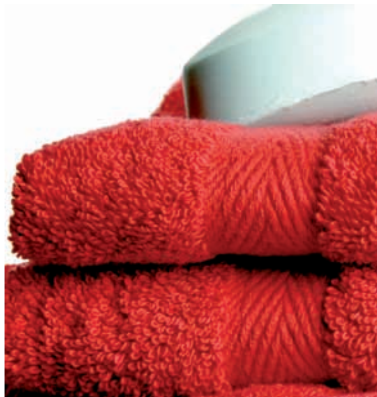
Brisače obarvajo in nadišavajo

Za pravo in popolno ugodje v kopalnici potrebujemo tudi brisače. Po sproščanju v topli kopeli je zavijanje v mehko brisačo ali ogrinjalo »pika na i«. Kapljice vode se počasi vpijajo v prefinjene materiale, ki na najbolj enostaven način nudijo ugodje in toplino ... Kot nujen kopalniški element se je brisača vključila tudi v domišljjski dizajnerski svet, ki v boju za kupce (potrošnike) ustvarja popolne in prekrasne rešitve.