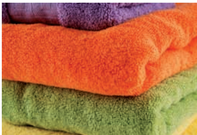
Brisače v barvah – zmeraj zanimiv izbor