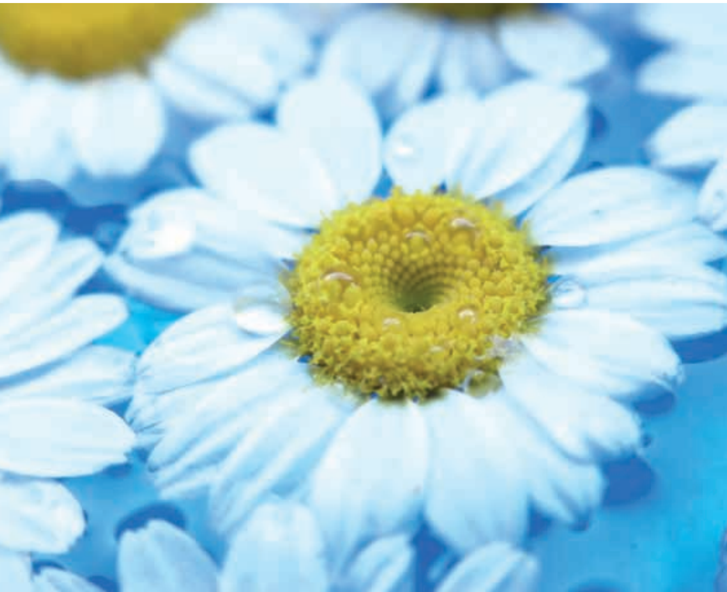
Občutite vonj cvetja